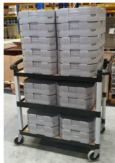
Hauteur du Plateau Tablotherm Cam GoBox: 12 cm